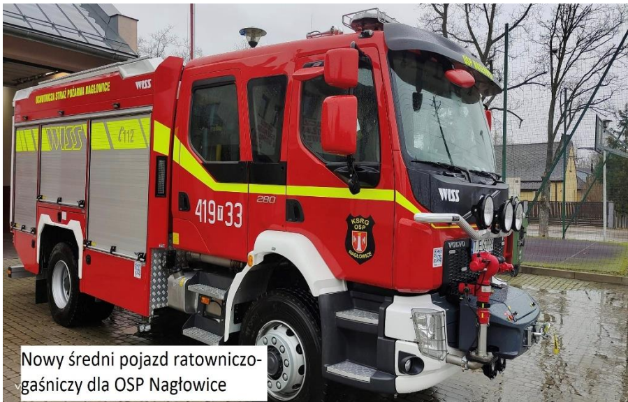
Nowy średni pojazd ratowniczo-gaśniczy dla OSP Nagłowice