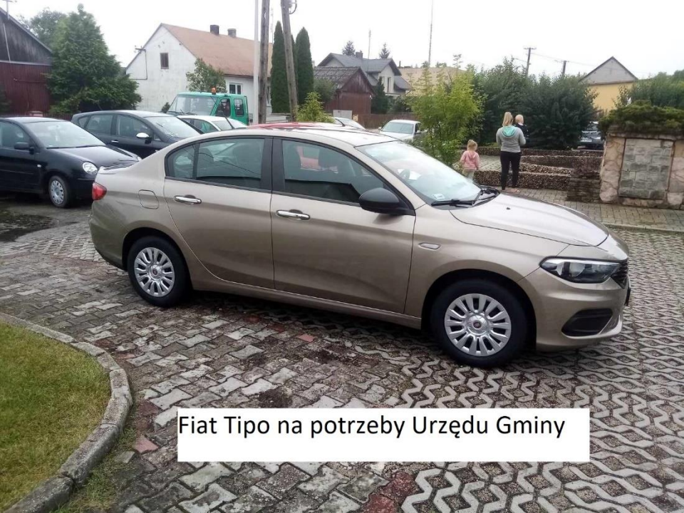
Fiat Tipo na potrzeby Urzędu Gminy