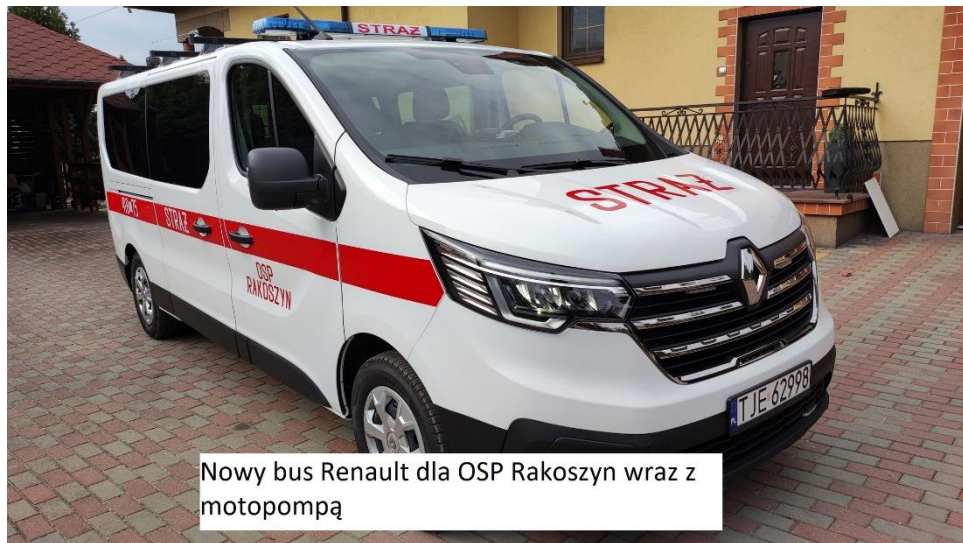
Nowy bus Renault dla OSP Rakoszyń wraz z motopompą