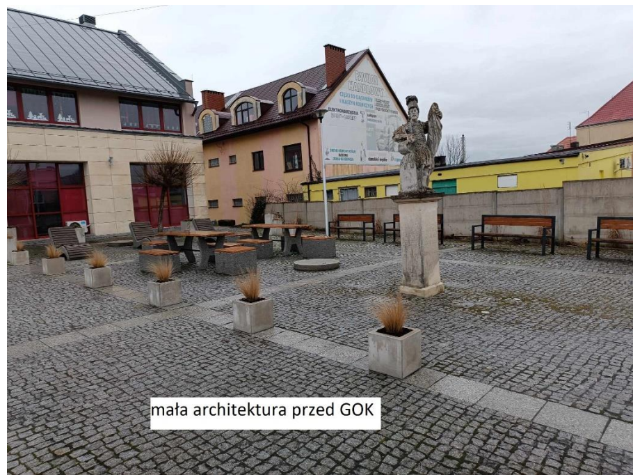
mała architektura przed GOK