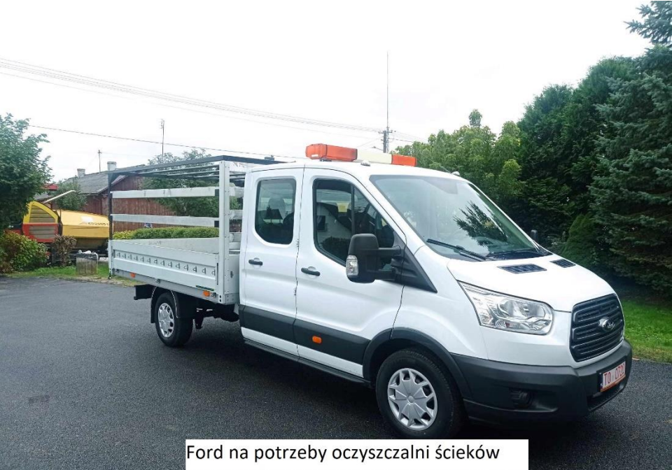
Ford na potrzeby oczyszczalni ścieków