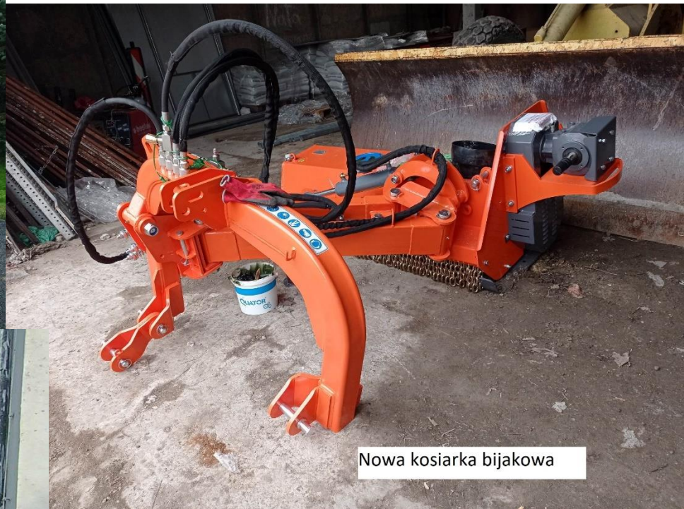
Nowa kosiarka bijakowa