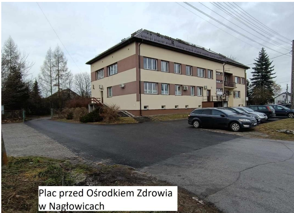
Plac przed Ośrodkiem Zdrowia w Nagłowicach