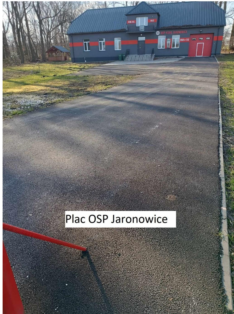
Plac OSP Jaronowice